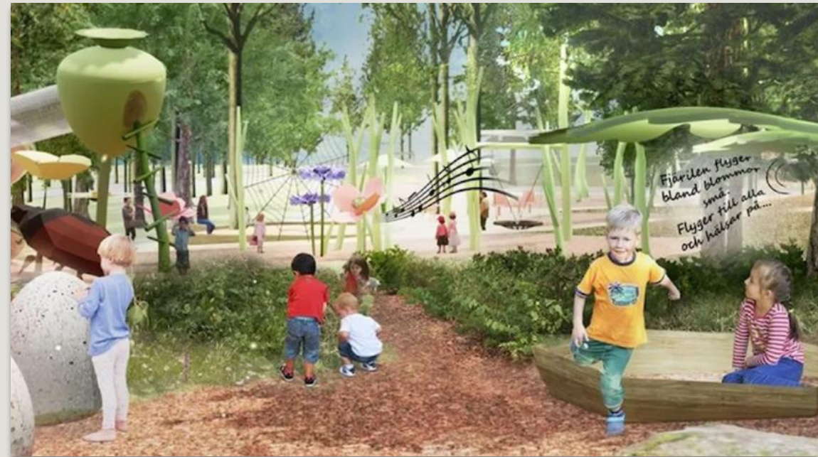
Uppkopplad lekplats i Linköping