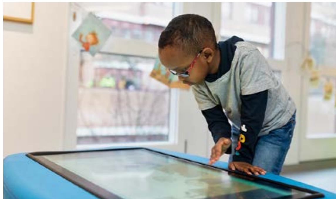
I Glänta finns ett Funtable med tillgång till digitala bilderböcker.

Letterbox Club vänder sig till barn i utsatta livssituationer: boende i familjehem samt i familjer med långvarigt försörjningsstöd. Syftet är att stimulera och väcka barnens nyfikenhet och lust att läsa, räkna och lära sig genom att de får paket med böcker, spel och skrivmaterial. Projektet finansieras av kommunernas socialtjänster samt bidrag från Kulturrådet och sker i samarbete med FoUrum social välfärd Region Jönköpings län, Stiftelsen Allmänna Barnhuset och En bok för alla. Under året har drygt 500 barn från hela landet deltagit. I Jönköpings län deltog drygt 160 barn från 10 kommuner. Under våren beviljades projektet medel från KUR för att utveckla mot mångspråk och tillgänglighet vilket sedan resulterat i uppstart av ytterligare arbetsgrupper för bokurval. I bokurvalsprocessen involverades barnbibliotekarier från länet. Nässjö kommun har tidigare med regionbibliotekets stöd utvecklat samverkan mellan folkbibliotek och socialtjänst. Med dem som pilot har vi under året utforskat lokal samverkan bibliotek-socialtjänst tillsammans med Aneby, Tranås, Vaggeryd, Vetlanda och Värnamo kommuner.