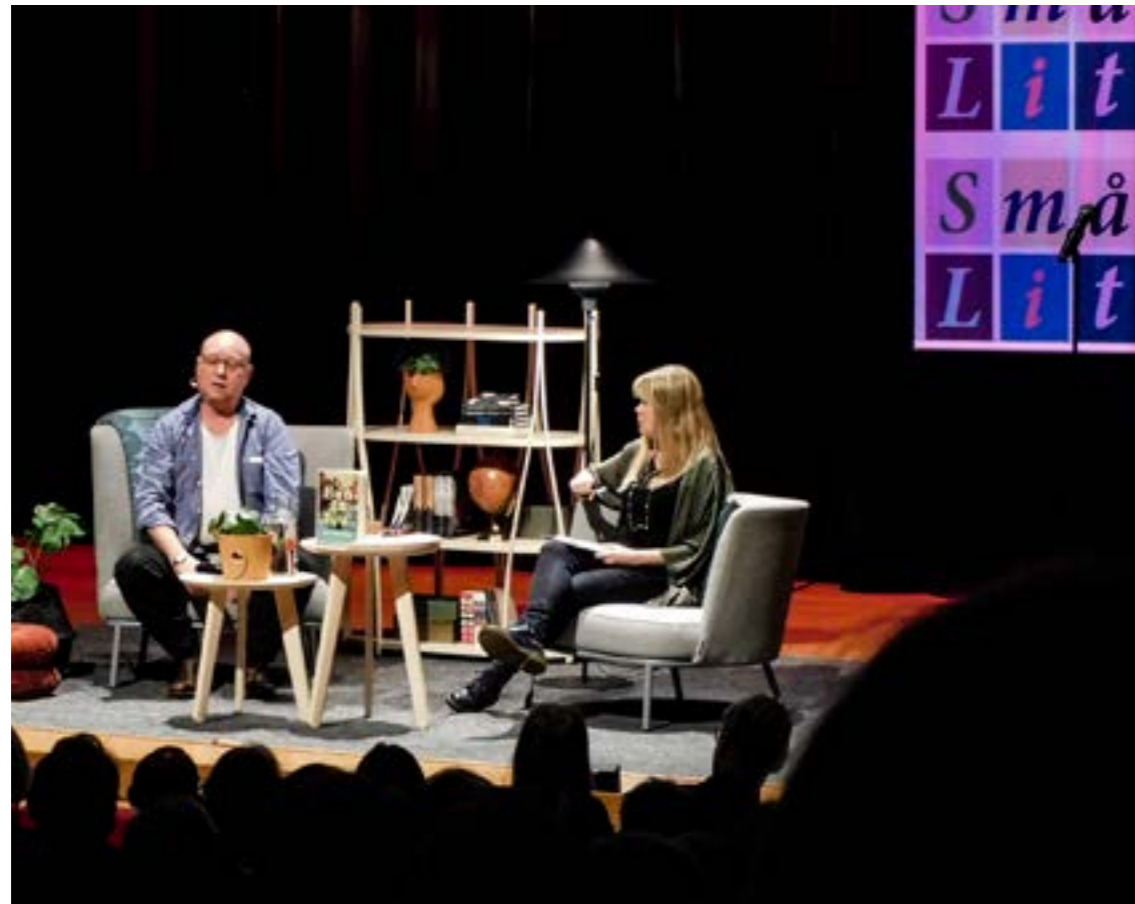
Smålands litteraturfestival genomfördes i februari 2020.

Litteraturen var också en del av utvecklingsarbetet som skett under Yttrandefrihet.