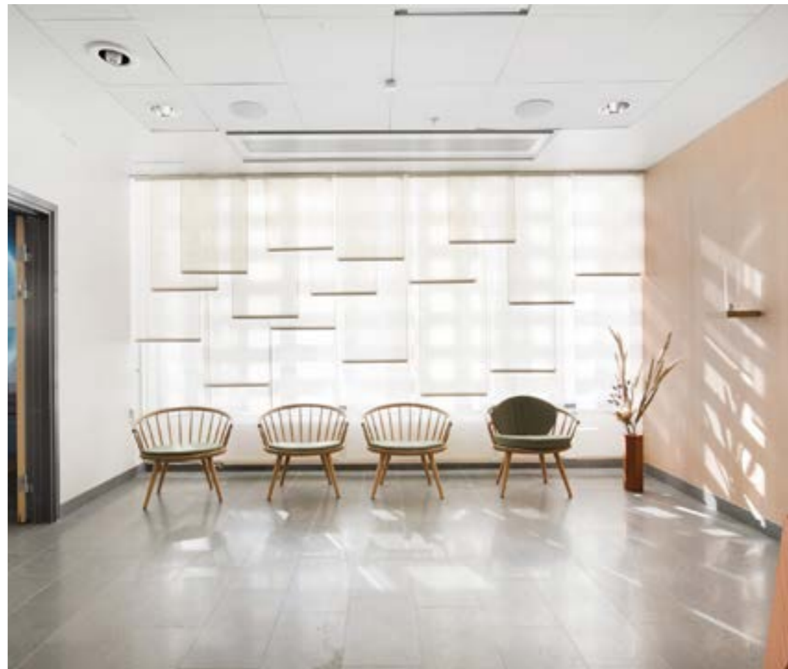
Vågor, meditations- och bönerum i Eksjö.

GESTALTNING LÖS KONST - Besiktning inköp gestaltning har försvårats 2020 på grund av pandemin.