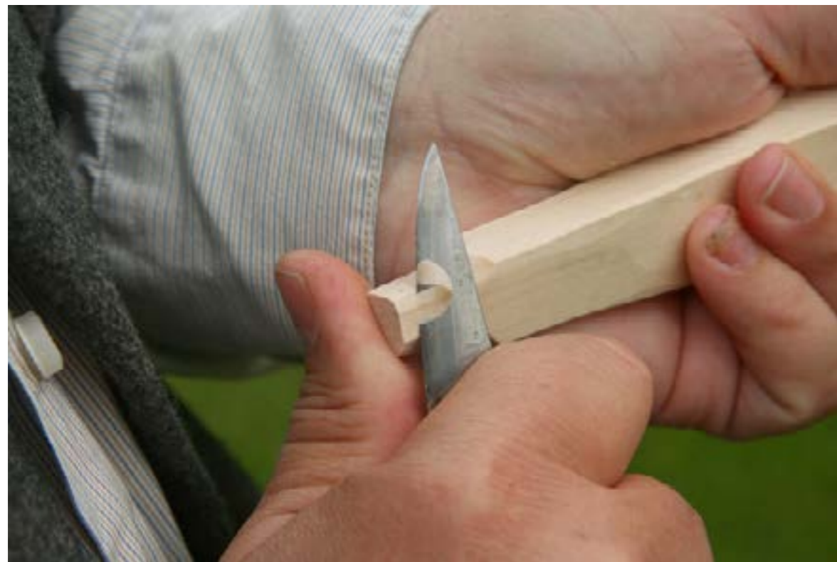
Täljkurs ordnades i samarbete med Kuturgatan Bodafors.

Den planerade inventeringen, med stöttande träffar av länets slöjdföreningar kunde inte genomföras på grund av pandemin. Via insamling av uppgifter till Händer fyra gånger per år hålls regelbunden och aktuell kontakt med föreningarna.