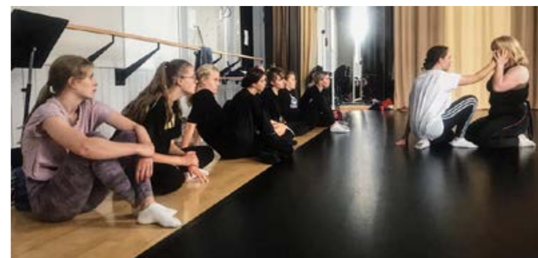
Skapa dans sommarskola.

Feriepraktik Kultur är ett regionalt projekt som ökar möjligheten till arbete, eget skapande och en inblick i olika kulturarbeten. Insatsen har under sommaren 2020 engagerat 146 ungdomar i 11 av länets kommuner. I år arrangerade vi sommarskolor inom tre olika konstområden: dans i samarbete med Unga Spira och Studieförbundet Vuxenskolan, film i samarbete med Skådebanan samt bild- och form/kulturarv i samarbete med Jönköpings läns museum.