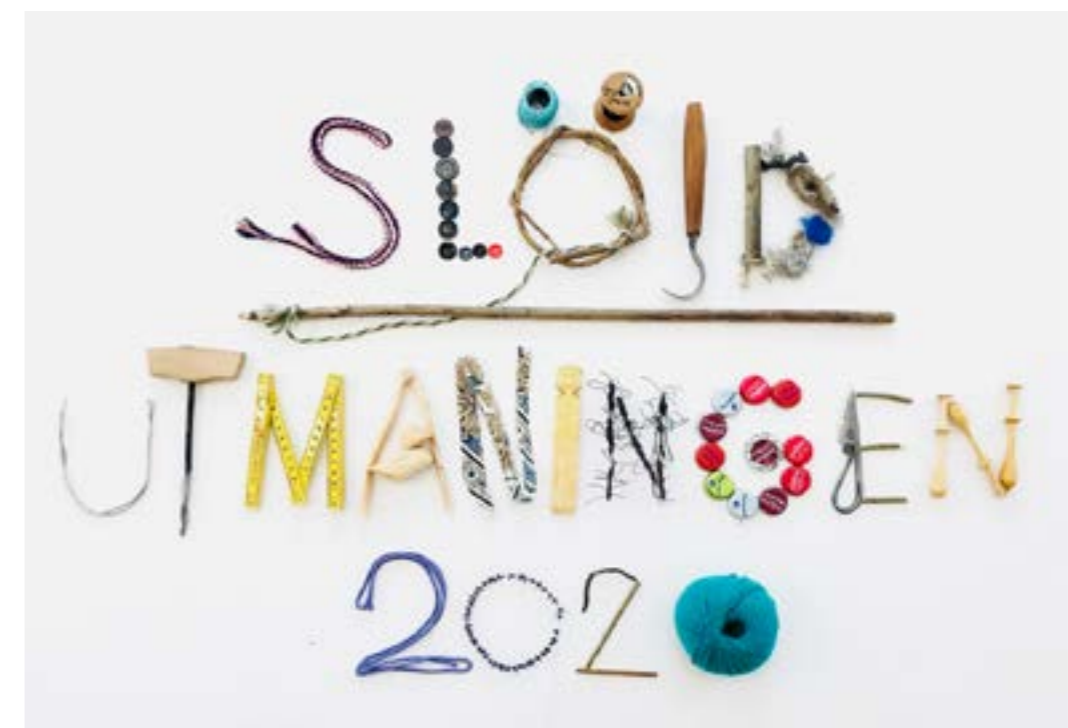
Slöjdutmaningen 2020 var ett sommarlovsprojekt i samarbete med Jönköpings kommun. Kas-sar med kreativt innehåll delades ut till barn på biblioteken i kommunen.

Åtta olika intressegrupper/nätverk/föreningar träffas regelbundet i Hemslöjdens Hus och de är verkamma inom områdena stickning, vävning, broderi, knyppling, lappsömnad och spinning/spånad. Genom att ge dessa grupper tillträde till vårt hus breddar vi arbetet i den civila sektorn. Under året har denna verksamhet pausats i omgångar. Försök till digitala möten har gjorts med gott resultat.